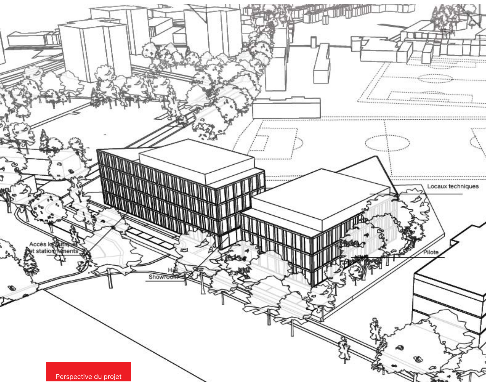
Perspective du projet