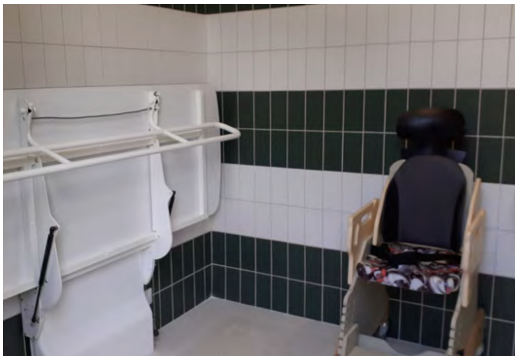
Photo de l'espace de change et sanitaire adapté au parc Mosaïc

Autre nouveauté de 2023, un espace adapté aux personnes à mobilité réduite a été créé. Cet espace de 6m 2 est ouvert pour les enfants comme pour les adultes qui ont un handicap moteur ou porteur de polyhandicap. Il est équipé d'une table à langer et d'une chaise adaptable pour les toilettes.