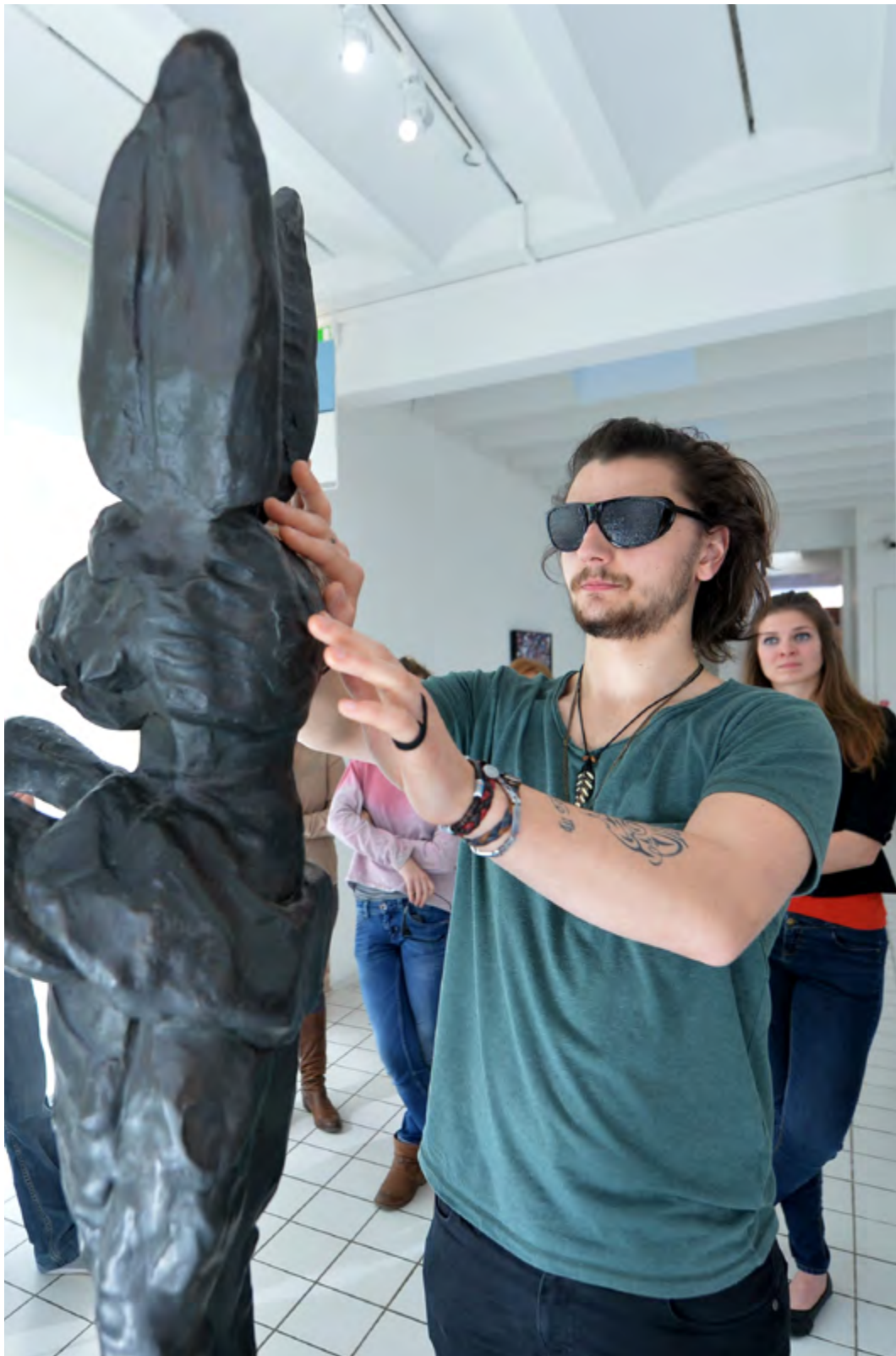
Photo d'une exposition tactile organisée au LaM