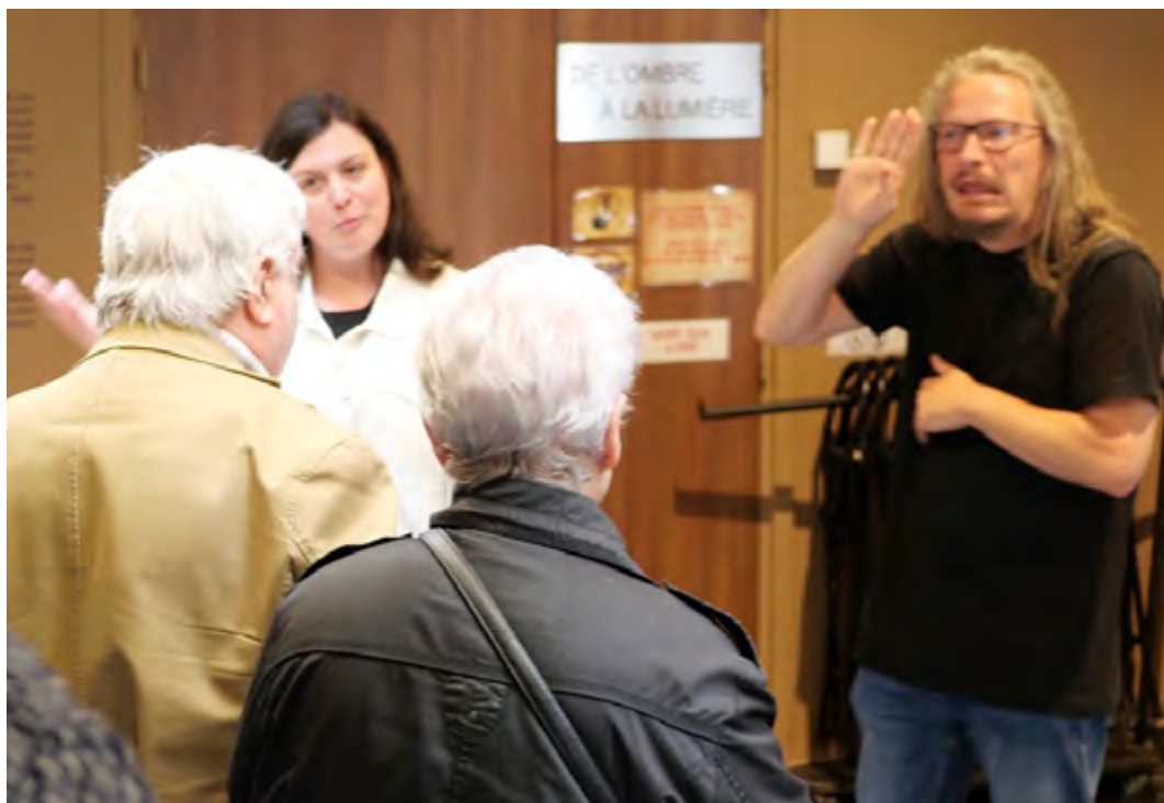
Photo d'une visite du musée de la Bataille de Fromelles avec un interprète en Langue des Signes Française