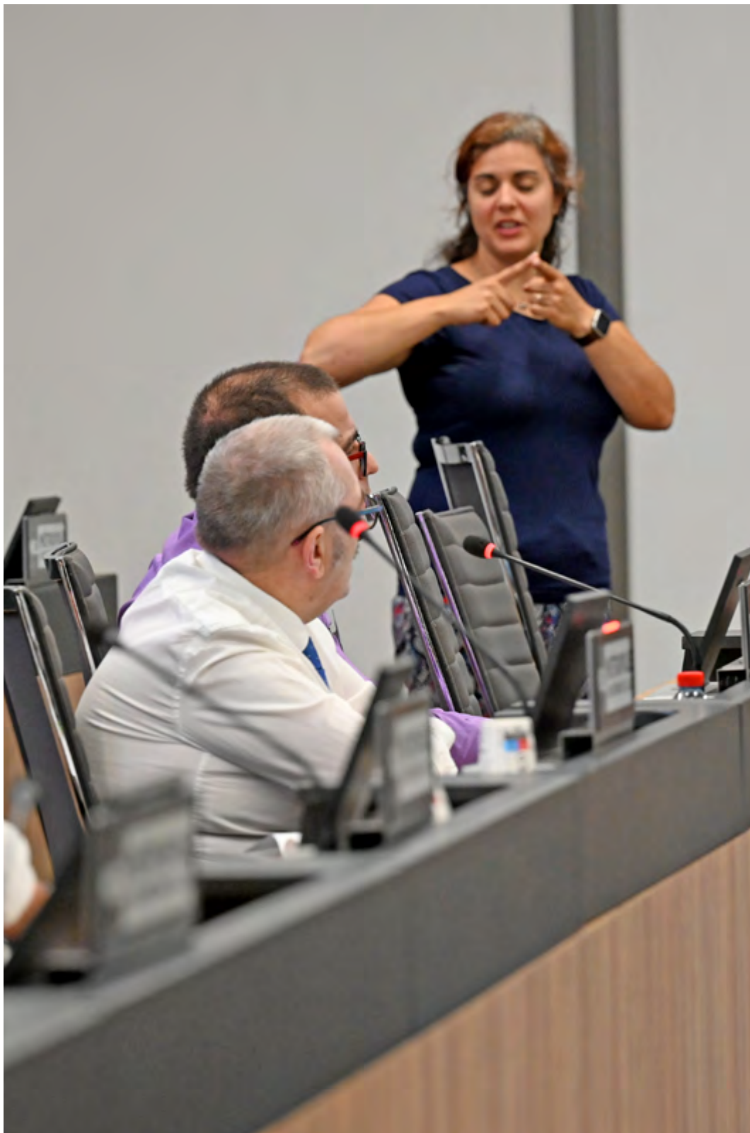
Photo de la séance de sensibilisation sur le FALC avec interprète langage des signes, en juin 2023