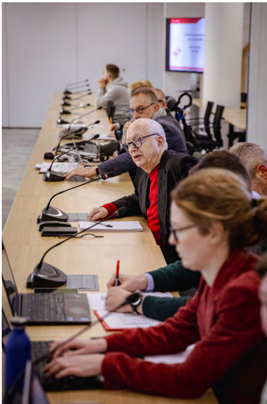
Photo d'une séance Plénière