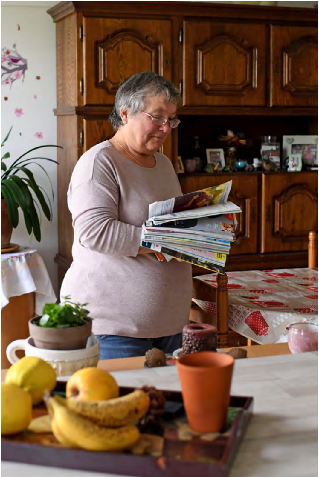
Photo de résidente dans un logement adapté au « bien vieillir » OCTAVE