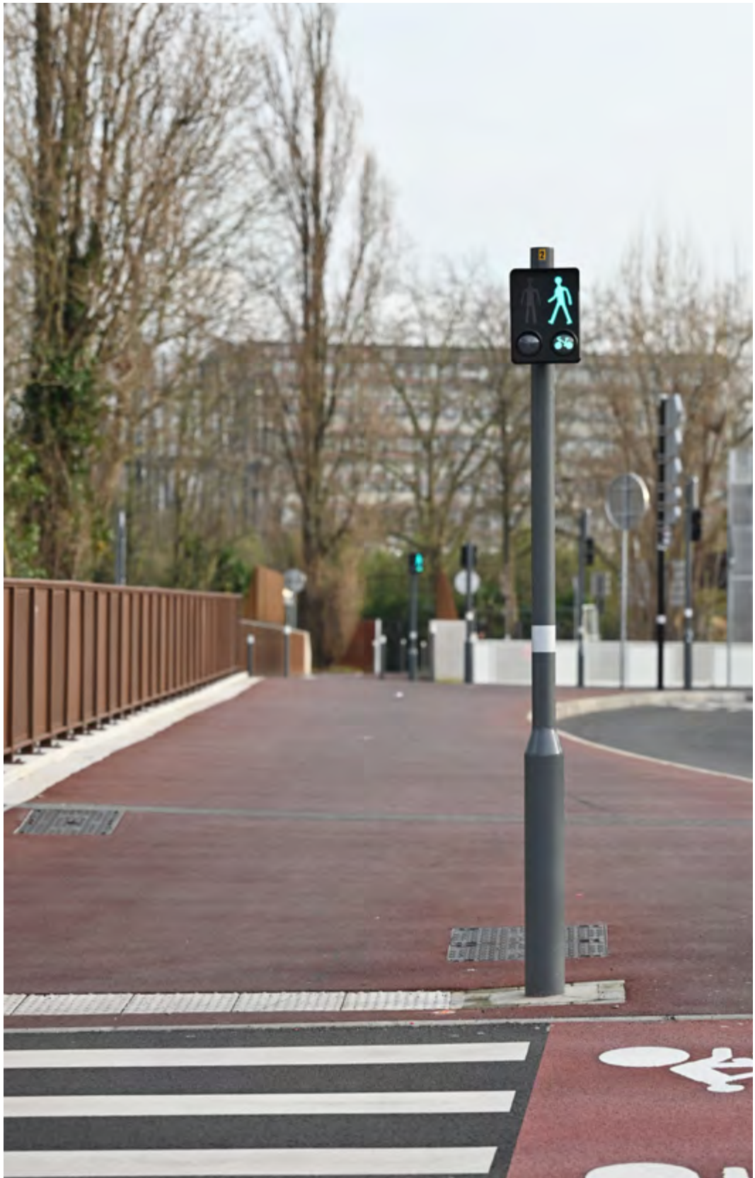
Photo d'un passage pour piétons avec feu tricolore et bande podotactile