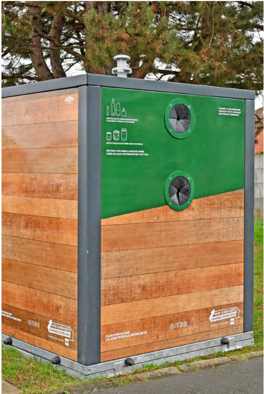
Photo d'une borne de point d'apport volontaire pour le verre, installée dans l'espace public