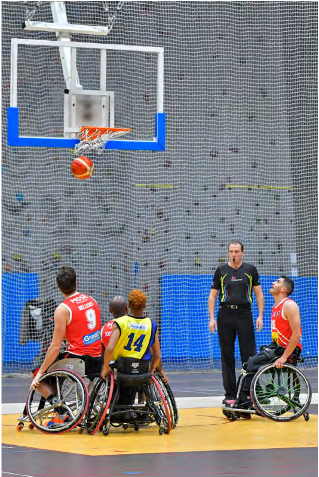
Photo d'un match de basket en fauteuils par le LUC Lille Handibasket