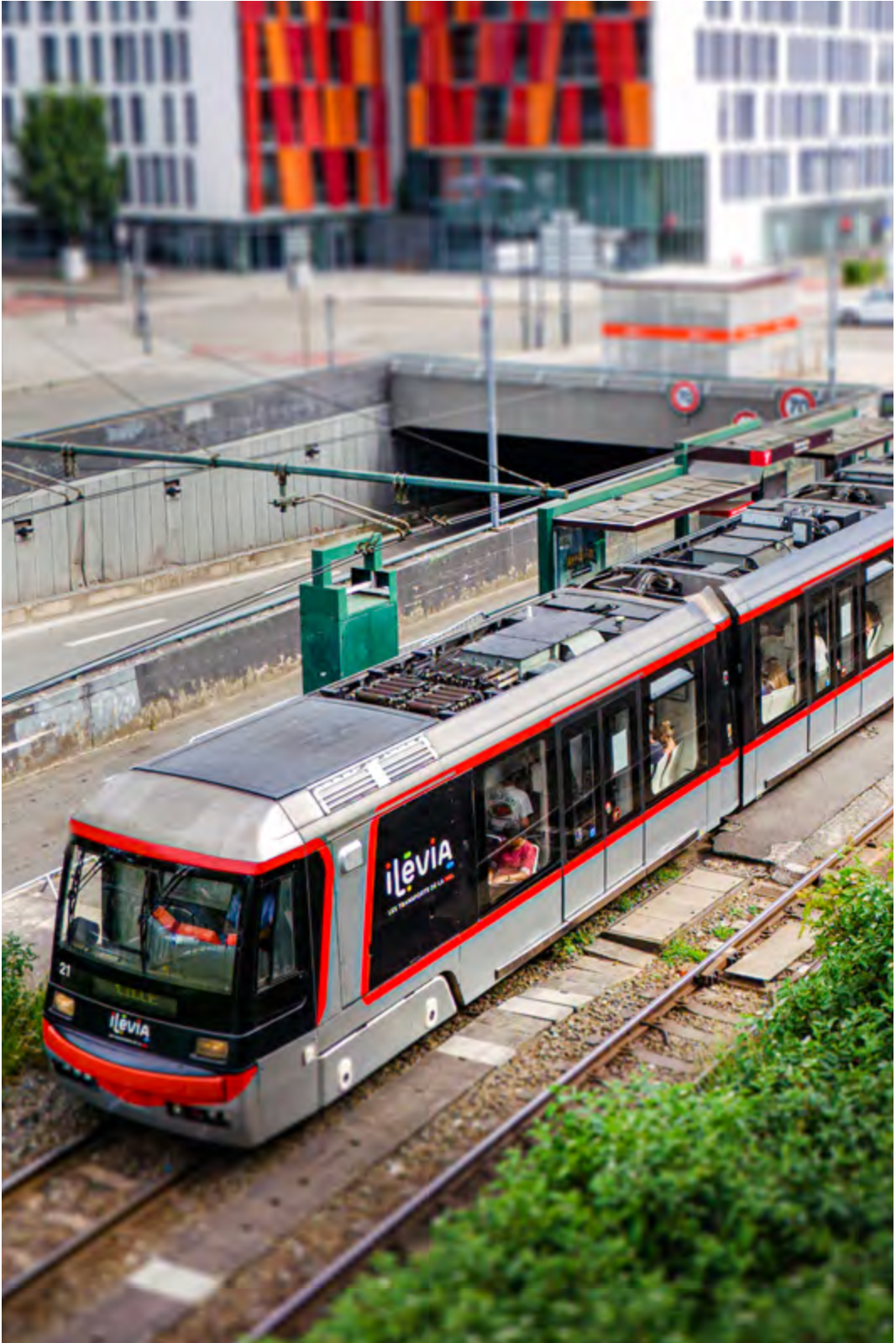
Photo d'un tramway Ilèvia