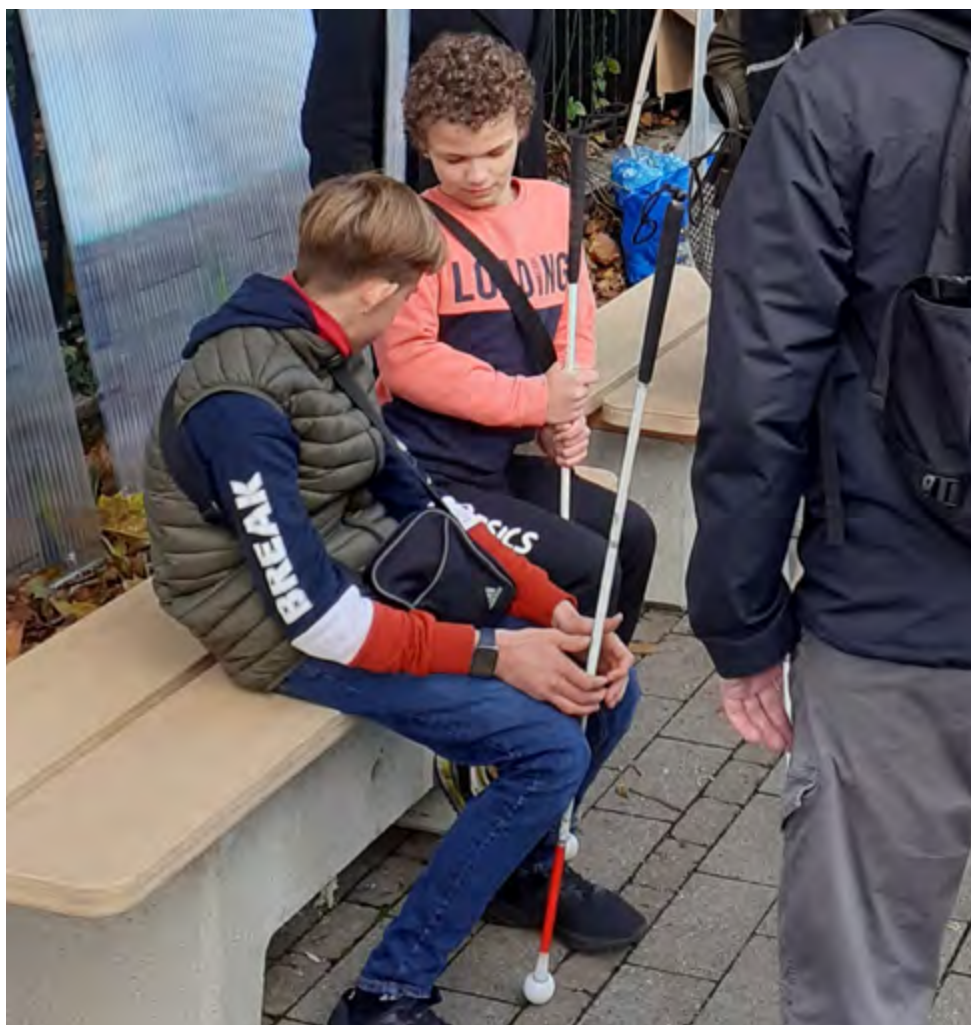
Photo de la visite de la CIA sur une station expérimentale du SDIT à Loos