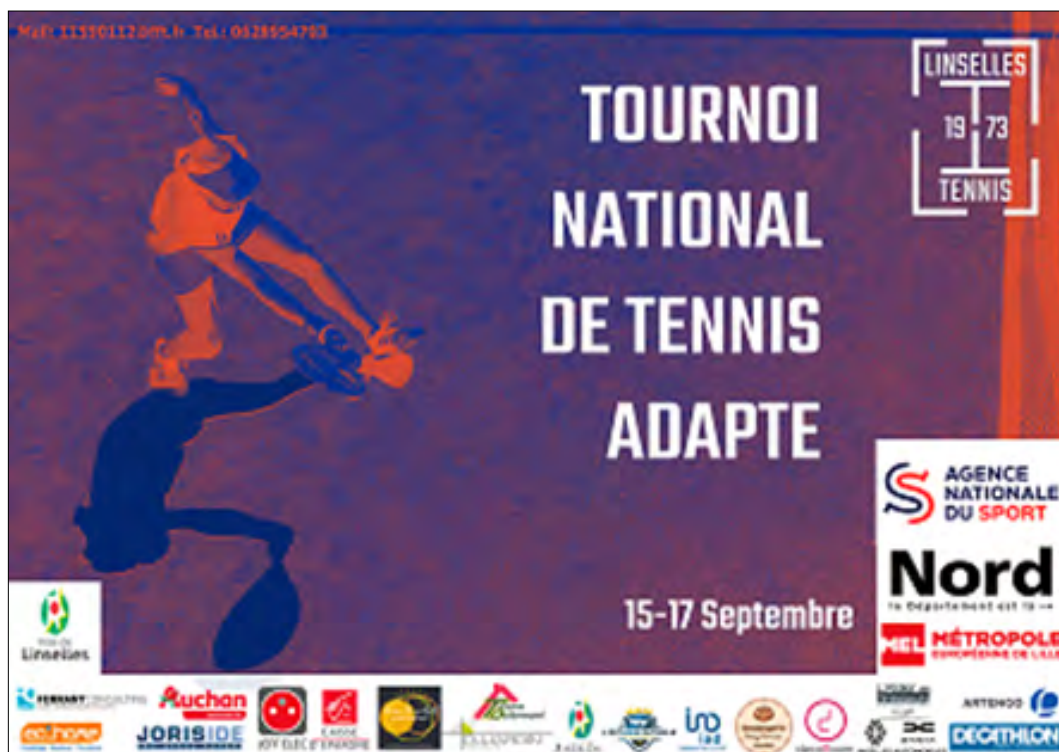
Affiche de promotion du tournoi national de tennis adapté de Linselles, septembre 2023