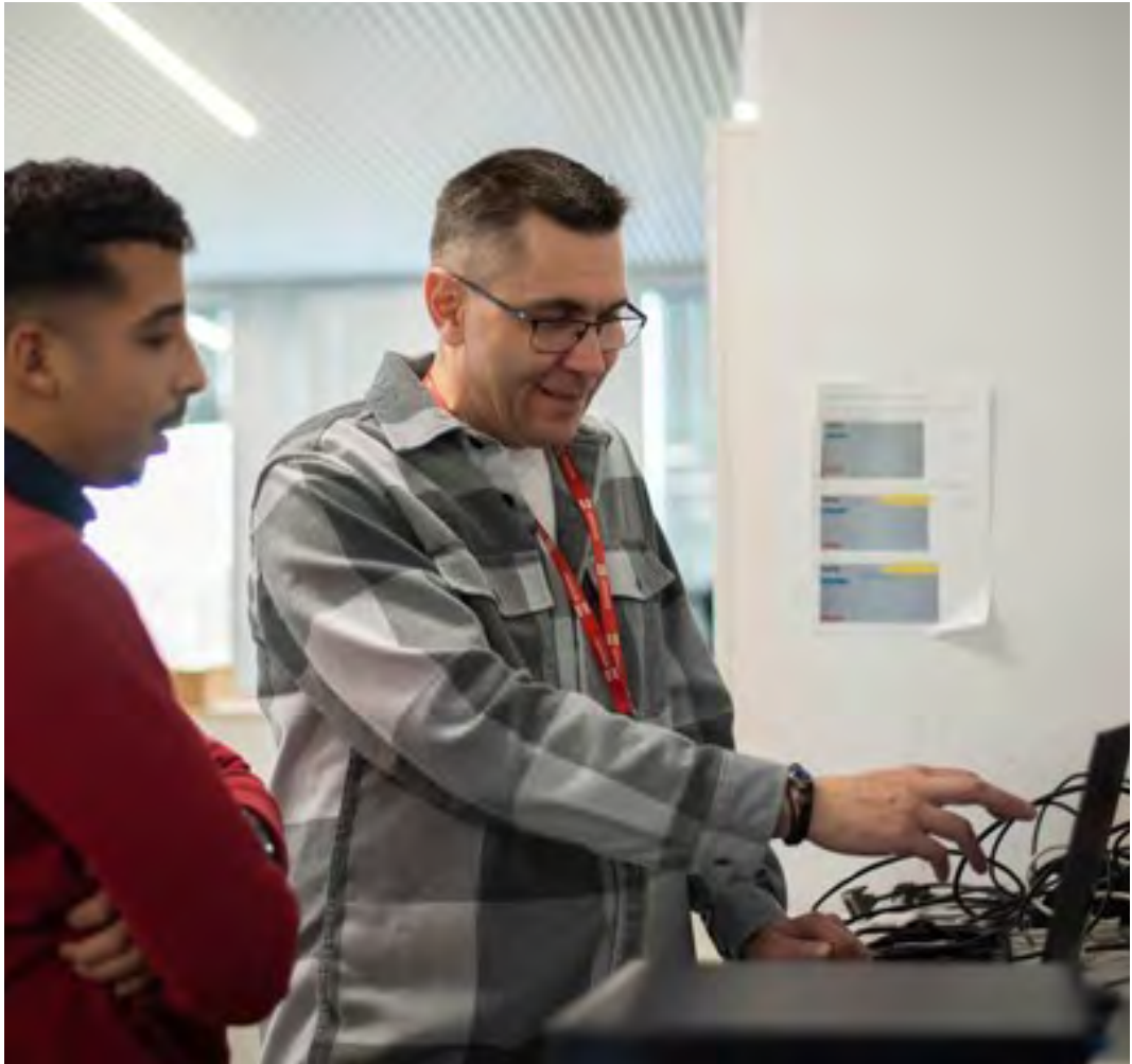
Photo d'un des duos composés pour le DUODAY 2023