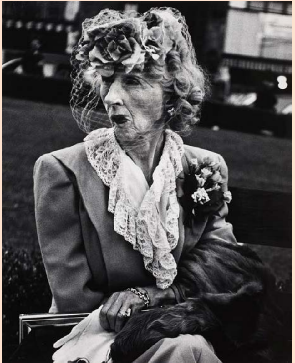
Lisette Model, Woman with Veil , San Francisco, 1949