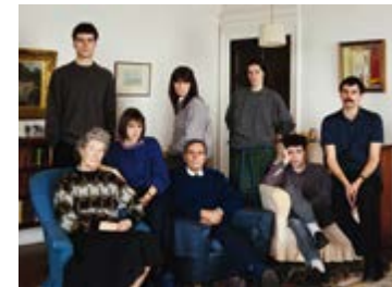
© Thomas Struth, The Smith family , Fife, 1989