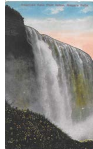
Cave of the wind in winter, Niagara Falls.

Cette nouvelle structure s'inscrit dans une approche fédératrice des initiatives et des expertises locales afin de doter la région d'une institution de référence dans le domaine de la photographie sur le plan national et international.