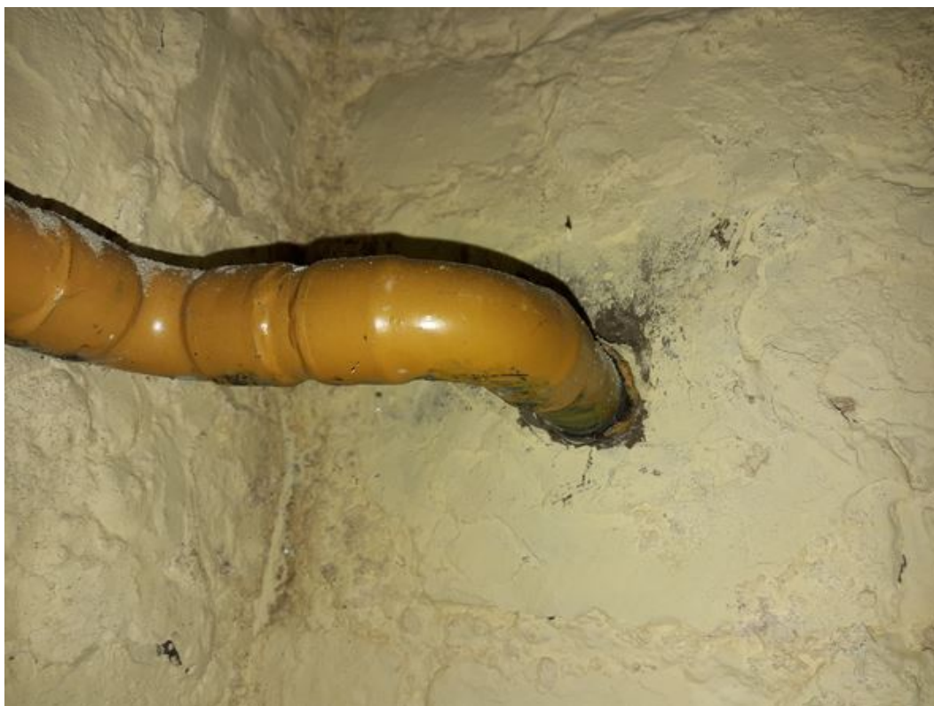
Espace annulaire non obturé / Chaufferie