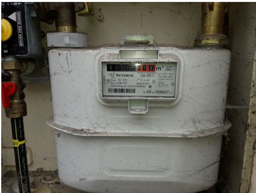
Compteur gaz / extérieur