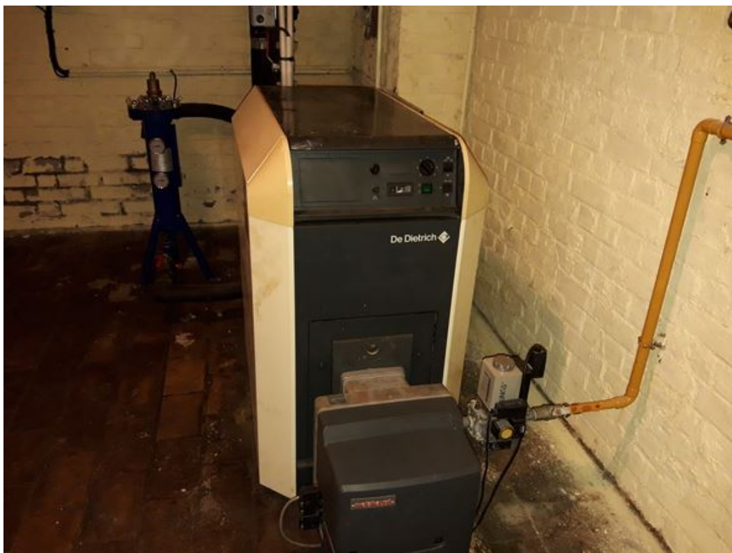
Chaudière au sol / chaufferie