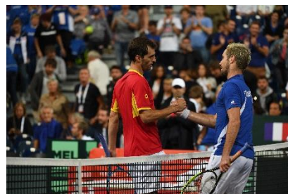
Le Stade Pierre-Mauroy est depuis 4 ans le stade de la Coupe Davis : finale France-Suisse en novembre 2014, victoire des Français face à la Belgique en novembre 2017 et demi-finale victorieuse face à l'Espagne en septembre 2018

Après avoir accueilli l'EuroBasket 2015, l'Euro 2016 de football, le Championnat du monde de handball, et de nombreux concerts de stars internationales, la MEL a une nouvelle fois saisi l'opportunité de promouvoir son territoire, ses richesses et ses valeurs au-delà de ses frontières. Ces événements sont de réels leviers de développement, aux retombées économiques, touristiques et médiatiques incontestables. Ils permettent à la MEL de s'affirmer davantage sur la scène internationale et d'offrir à ses habitants des spectacles grandioses.